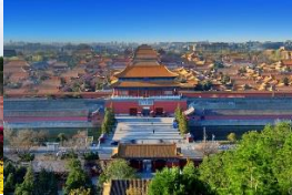
Die Verbotene Stadt