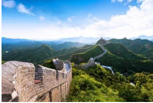
Die Große Mauer