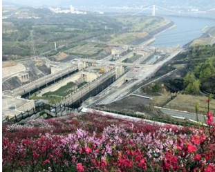
Drei Schluchten Staudamm