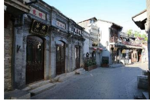
Beijing Hutong-Tour mit einer entspannten Rikscha

Nach dem Frühstück im Hotel werden Sie die Große Mauer besichtigen, die das chinesische Kaiserreich vor nomadischen Reitervölkern aus dem Norden schützen sollte, aber es hatte nie ganz ihren Zweck erfüllt. „Wer nicht auf die große Mauer gestiegen ist, ist kein wahrer Held“ diese Volksweisheit zeugt von dem großen Respekt, den die Chinesen diesem Bauwerk erweisen. Anschließend besuchen Sie das berühmte Forschungszentrum für chinesische traditionale Medizin. Danach genießen Sie unsere Beijing Hutong-Tour mit einer entspannten Rikscha.